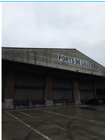
Matériaux : ZPSO-003 Prélèvement : Description : Bardage fibres-ciment Localisation : Extérieur - Façade côté BREVIERE; Extérieur - Façade côté SCANROAD Résultat : Présence d'amiante