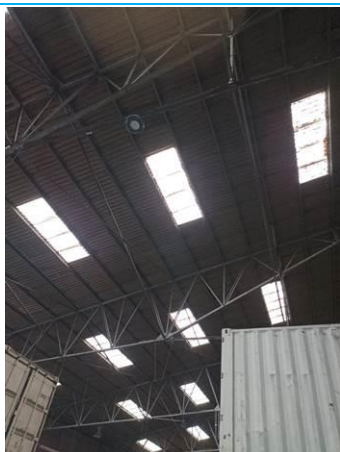
Matériaux : ZPSO-001 Prélèvement : Description : Plaques fibres-ciment Localisation : Extérieur - Toiture Résultat : Présence d'amiante