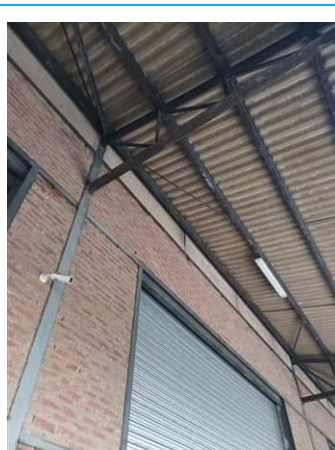
Matériaux : ZPSO-004 Prélèvement : Description : Plaques glasal en bardage Localisation : Extérieur - Façade côté BREVIERE Résultat : Présence d'amiante