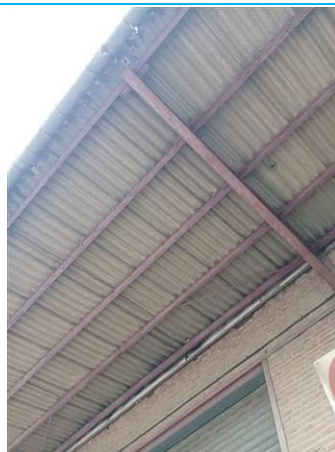
Matériaux : ZPSO-002 Prélèvement : Description : Plaques fibres-ciment Localisation : Extérieur - Auvents Résultat : Présence d'amiante