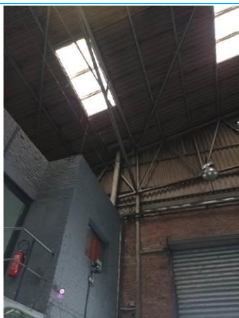
Matériaux : ZPSO-005 Prélèvement : Description : Conduit d'aération Localisation : Extérieur - Toiture Résultat : Présence d'amiante